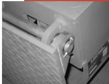
Bisagra abierta máxima duración