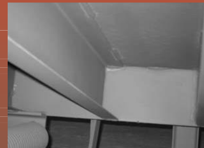
Soporte trasero de 5 secciones alta seguridad