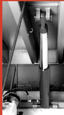
Cilindro de plataforma 4"