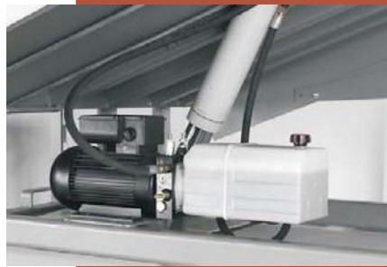
Unidad de Poder Electro-Hidráulica

GARANTIA: Limitada a 24 meses en todo el equipo y mano de obra al momento de arribar a proyecto. Garantía extendible a 5 años en la estructura previa aprobación del fabricante.